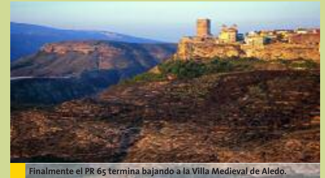
Finalmente el PR 65 termina bajando a la Villa Medieval de Aledo.

PR 65 sigue su trazo común al GR 252 y al PR 64, bajando un poco hasta pasar junto a un viejo olivo. Luego remonta diagonalmente a la derecha y sale ante un bancal de almendros, que seguimos a la derecha (km 1,11 / Alt. 661 m) hasta la casa de El Zorro, donde hay un cruce de caminos que tomamos a la derecha.