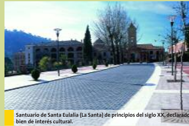
Santuario de Santa Eulalia (La Santa) de principios del siglo XX, declarado bien de interés cultural.