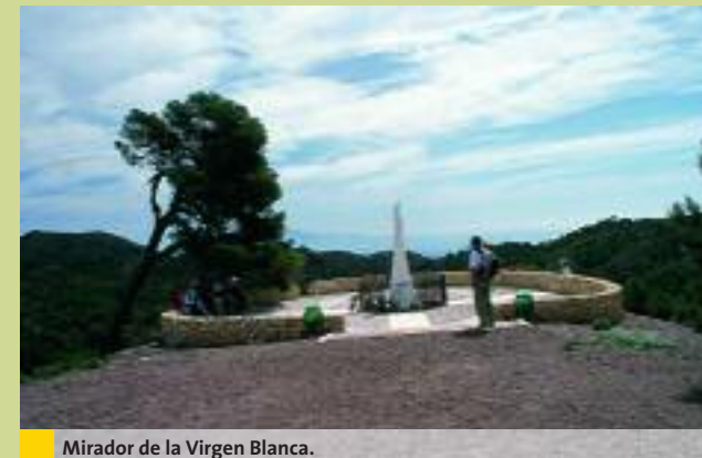
Mirador de la Virgen Blanca.

A la salida de un pinar donde vemos abajo la casa del Pocico, el