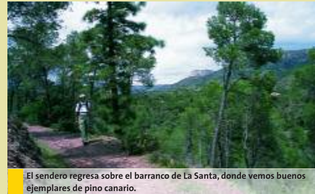
El sendero regresa sobre el barranco de La Santa, donde vemos buenos ejemplares de pino canario.

Seguindo este camino principal (S.P.P), sin entrar a los caminos