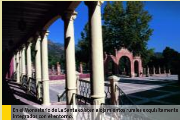
En el Monasterio de La Santa existen alojamientos rurales exquisitamente integrados con el entorno.